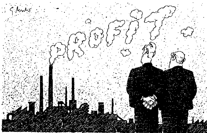
„Giftig oder nicht — vom betriebswirtschaftlichen Standpunkte aus isses beeindruckend!“

stoffen sicher vorauszusagen. Desgleichen ist es un-möglich, für die Stabilität von »Freisetzungsbarr-ieren« langfristige Garantien zu geben. Dieses Problem läßt sich weder durch ein verfeinertes analytisches In-strumentarium noch durch die Weiterentwicklung von leistungsfähigen Computer-Simulationsmodellen als prognostisches Instrument lösen. Damit gewinnt das Element der Vorsorge, hier insbesondere der vorsorg-lichen Vermeidung bestimmter Reststoffe, eine ganz entscheidende Bedeutung. Dies kann in letzter Konse-quenz bedeuten, daß vorsorglich entsprechende Pro-duktionsverfahren oder Produktlinien eingestellt wer-den müssen.