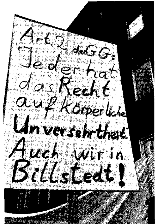
Nach bestialischem Gestank und Gesundheitsgefährdung durch die AFFI erinnern Anwohnerinnen an das Grundgesetz

Nach dieser „Regel“ „beseitigt“, wie eingangs erwähnt, Hamburg seine kontaminierten Bagger-schlämme aus dem Hafenbereich.