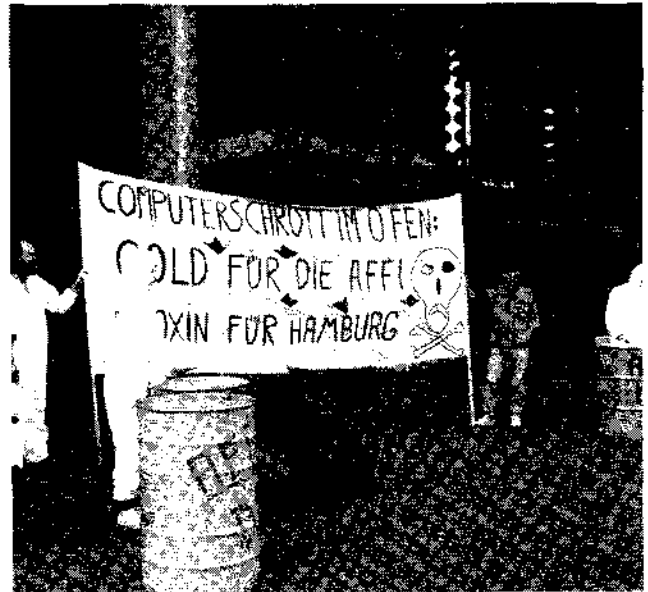
Die verbotene Verbrennung von Computerschrott in einem Schmelzofen scheint nicht allen zu schmecken

5. Die Verbrennung von Abfällen (Schrotte und Kunststoffe im Gemisch) in den Schachtöfen einer gr. Kupferhütte im Osten Hamburgs wird vom Betreiber dieser genehmigungsbedürftigen Anlagen nicht als „wesentliche Änderung angesehen“ und daher der Genehmigungsbehörde 1976 auch nur mitgeteilt. Die Behörde schließt sich der Auffassung der NORD-DEUTSCHEN AFFINERIE an, ohne weiter nach der Art des zu verbrennenden Schrotts zu fragen. Somit entfällt eine Änderungsgenehmigung nach Paragraph 15 BImSchG, die Öffentlichkeit bleibt ausgeschlossen (BüDrs. 13/597, 1987).