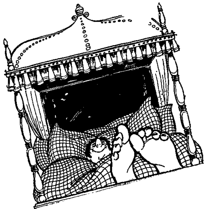
mind. 15 Jahre gepennt

Inkrafttreten des Abfallbeseitigungsgesetzes (AbfG). Es fordert die Aufstellung von »Plänen zur Abfallbeseitigung nach überörtlichen Gesichtspunkten« (§6, AbfG).