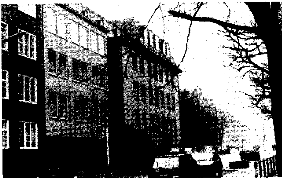
Abb. 94 Verwaltungsgesäude Alsterterrasse