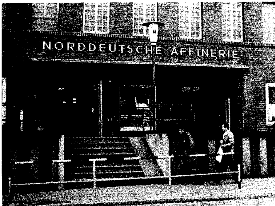
Abb. 93 belegschaftsreineingang Hovestraße